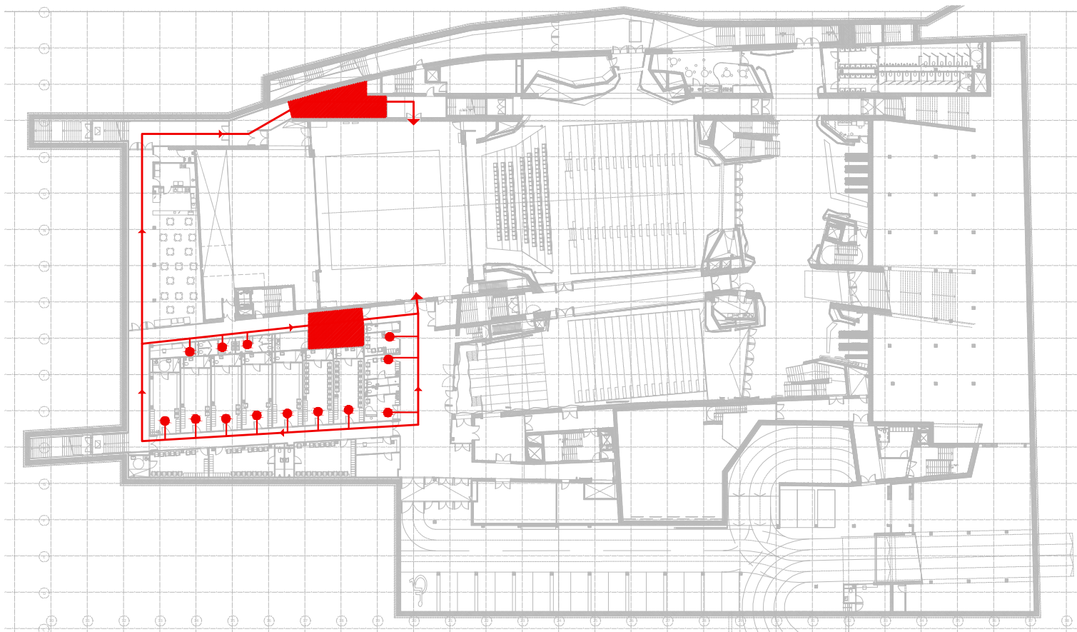
3. DROGA DOSTĘPU ARTYSTÓW DO GARDERÓB I SCENY RZUT POZIOMU 0